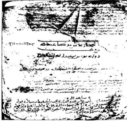
الورقة الأولى (ق ١٩) من الكتاب

İbn Vehb'in öğrencisi Yunus b. Abdu'l Alâ es-Sadeffî rivâyetiyle nakledilen Kitabu'l-Muhârebe mine'l-Muvatta adlı esere ait nüshanın ilk ve son varakları aşağıda verilmiştir.